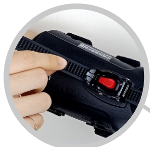
可調式腕關節 隨時保持在最佳角度

如有中風、腦傷、脊髓損傷等， 造成手部有張力無法打開時，找 BALDUR 巴德爾 就對了！ 不受限於環境，有效提高訓練強度，讓手部功能訓練隨時隨地皆可進行。