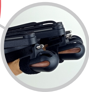
全覆式指套 確保手指完全伸展