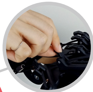
五指調節繩 獨立調整